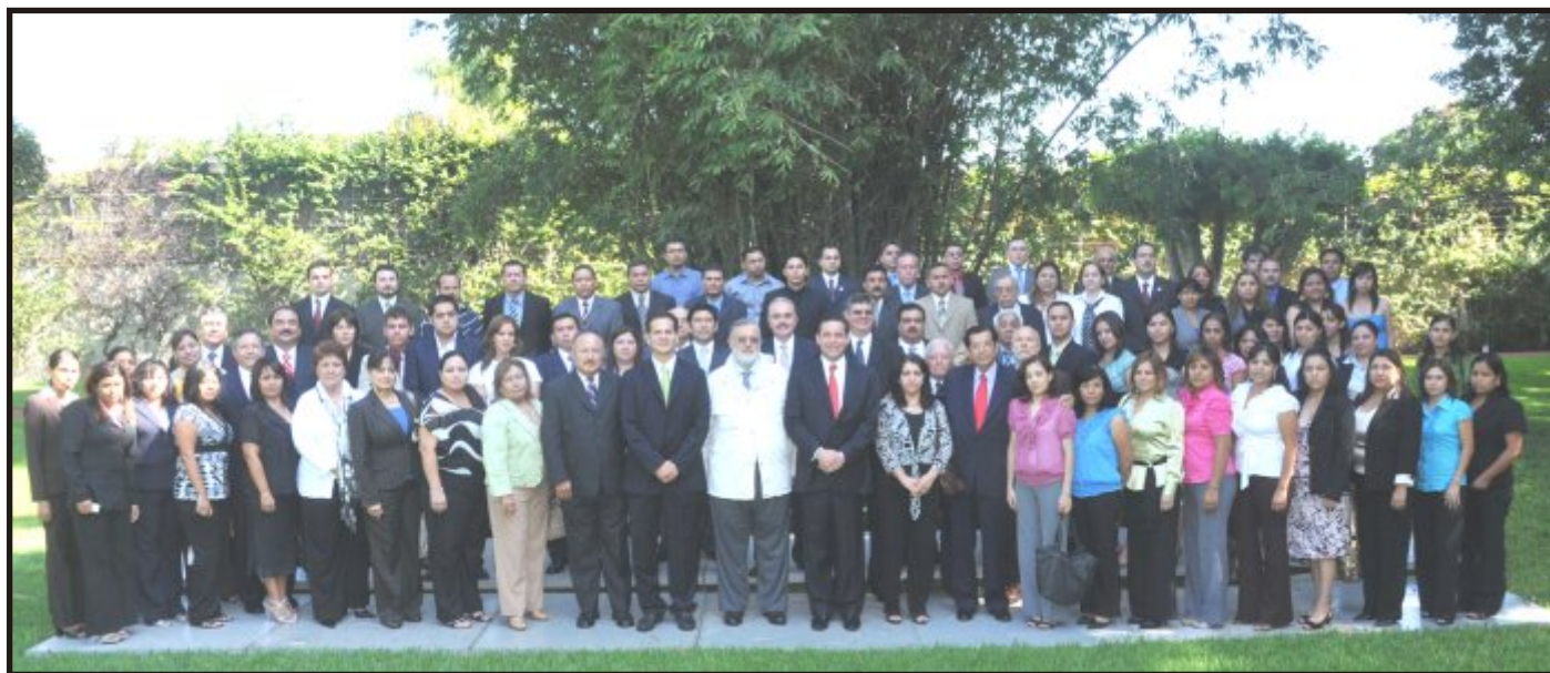
Fotografía de grupo en XVIII Aniversario de la CODHET, acompañados del Gobernador del Estado Ing. Eugenio Hernández Flores y el ahora ex titular de la CNDH Dr. José Luis Soberanes Fernández.

En nuestro país, el artículo 102 apartado B de la Constitución General de la República señala que el Congreso de la Unión y las legislaturas de las entidades federativas, en el ámbito de sus respectivas competencias, establecerán organismos de protección de los derechos humanos que ampara el orden jurídico mexicano, los que conocerán de quejas en contra de actos u omisiones de naturaleza administrativa provenientes de cualquier autoridad o servidor público, con excepción de los del Poder Judicial de la Federación, que violen estos derechos. Se agrega que los citados organismos formularán recomendaciones públicas, no vinculatorias y denuncias y quejas ante las autoridades respectivas, aclarando que no serán competentes tratándose de asuntos electorales, laborales y jurisdiccionales.