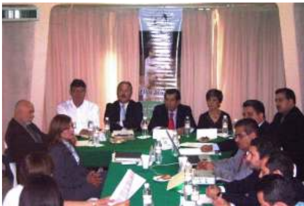
Aspectos generales de la sesión de Consejo 2/08