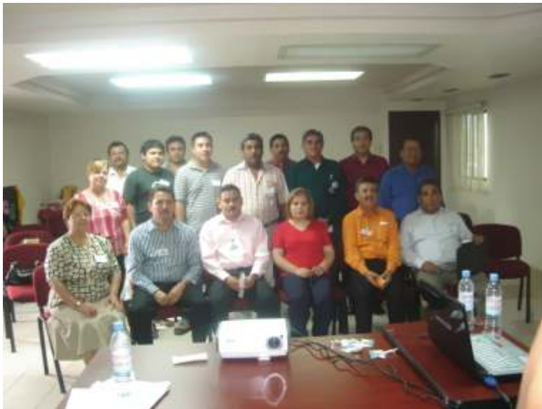
La conferencista visitante, el personal de la CODHET en Matamoros y los miembros de la ONG.