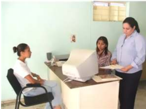
Todo individuo que se encuentre en territorio nacional goza de las garantías que otorga nuestra Carta Magna.

A las instalaciones de la Delegación Regional de Nuevo Laredo, se presentó una mujer de nacionalidad hondureña quien mencionó que su estancia en nuestro país era de manera ilegal, por lo que solicitó apoyo por haber sido abandonada por una persona con la que vivía de origen mexicano y con la que había procreado una menor que actualmente contaba con dos años y además presentaba embarazo, sin embargo, no se hacía responsable de la manutención de la menor ni de los gastos médicos de su embarazo, señalando que esta persona la amenazaba con denunciarla al Instituto Nacional de Migración y por ese motivo tenía temor de acercarse alguna autoridad para que atendieran la situación en torno a sus hijos. En tal virtud, se le brindó asesoría respecto a su situación legal en nuestro país, por otra parte, se le habló sobre los derechos fundamentales que tiene todas las personas en el lugar en que se encuentren sin importar su raza, sexo o condición de cualquier otra