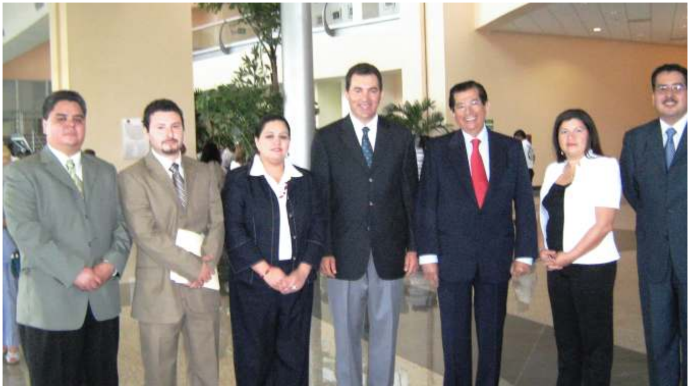
Fotografía del Recuerdo