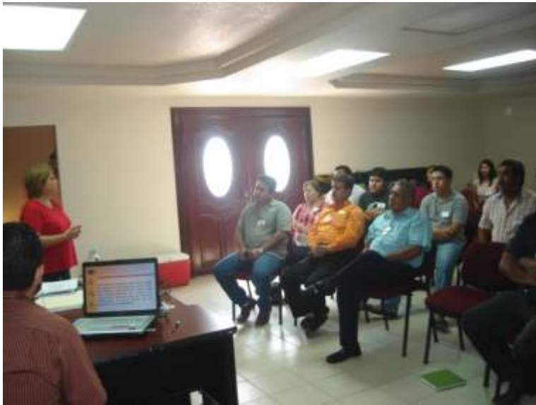
Integrantes de la asociación civil atendieron con interés la plática de la representante de la CNDH.