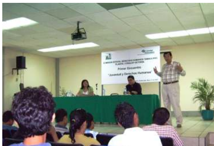
Mensaje e bienvenida por parte del Ombudsman.