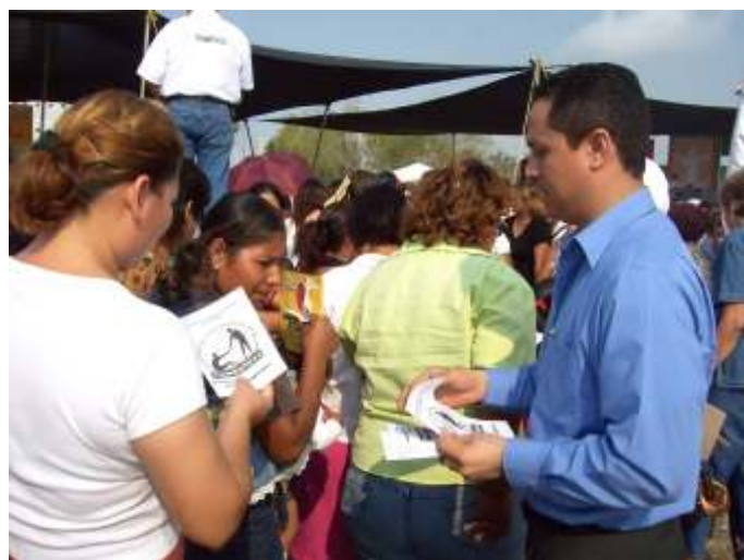
Se distribuyo material en la Expo Mujer.

Dentro de la Expo, diversas instituciones instalaron módulos de servicio afines a los intereses de la mujer, ente ellos, destacó el módulo de este Organismo donde se brindaron diversas atenciones como lo fueron asesorías jurídicas y divulgación de los derechos humanos a través de trípticos y otros materiales impresos de gran interés para el público presente. En este sentido, la CODHET, ha establecido