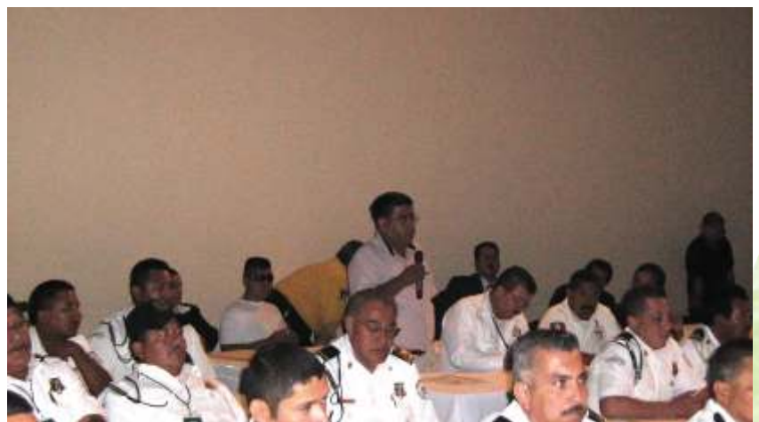
Numerosa fue la participación de los cuerpos de seguridad pública.