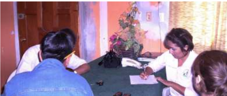
La Delegada Regional de El Mante acudió al domicilio de los familiares de un connacional para informarles sobre su situación jurídica.

La Delegación Regional en El Mante ha atendido diversos ciudadanos de aquella región que acuden a las instalaciones de esta Comisión para solicitar apoyo referente a conocer la situación legal y de salud que guardan sus familiares que se encuentran privados de su libertad en los Estados Unidos. Por tal razón, se llevaron a cabo diversas acciones ante los Consulados de México en las ciudades de Dallas, San Antonio y Nuevo Laredo, Texas, quienes brindaron toda la información requerida la cual fue oportunamente otorgada a los peticionarios, en ese sentido, es menester destacar y agradecer a estos Consulados por la