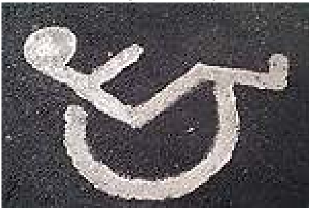
Resultado de la intervención de este Organismo se pone atención a los espacios necesarios para las personas con discapacidad.

Las personas con algún tipo de discapacidad gozan sin restricción alguna de los mismos derechos y libertades que el resto de los individuos que son reconocidos en nuestros ordenamientos jurídicos nacionales, así como en instrumentos internacionales en materia de derechos humanos suscritos y ratificados por nuestro país; sin embargo, desafortunadamente prevalece una subcultura aún arraigada de no respetar los derechos fundamentales de las personas, sobre todo de aquellas que por sus condiciones de salud, edad, género etcétera son más vulnerables a sufrir algún tipo de discriminación o limitación para el desarrollo de sus prerrogativas.