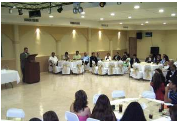
Los asistentes atentos a la exposición.