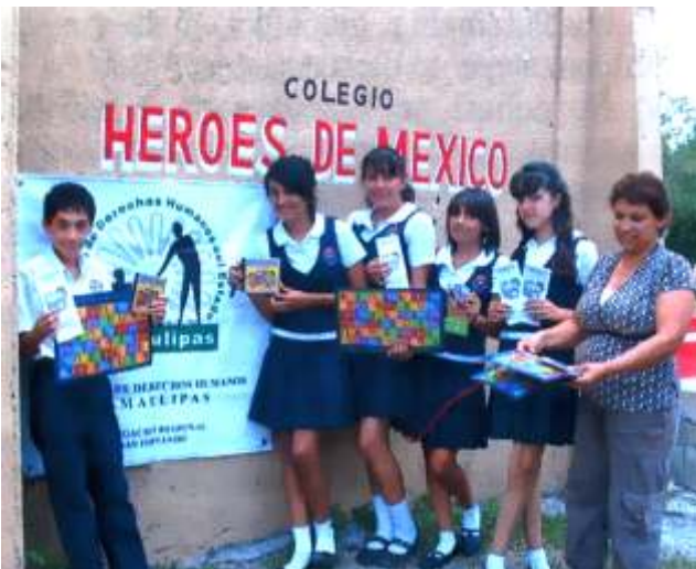
Los niños juegan y aprenden a través del dinámico Programa Niños Promotores