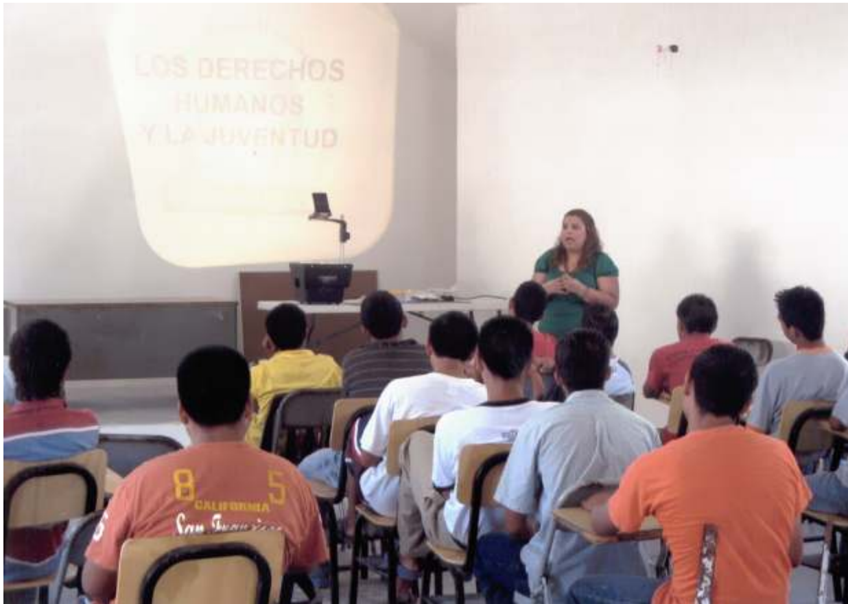
Los jóvenes son informados sobre los derechos fundamentales