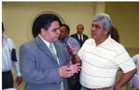
La atención a los medios de comunicación es importante.