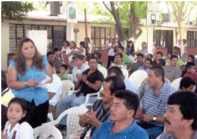
Difundiendo los derechos humanos en Reynosa.

Dentro del ámbito de la promoción y difusión de los derechos humanos, esta la Delegación Reynosa ha venido trabajando con intensidad. Podemos señalar que ha venido participando como invitada dentro del Programa "Comunidad UNI", transmitido por la U.A.T., y dentro del cual se han tratado diversos temas de actualidad en relación a los derechos humanos. Destacan los vinculados a los Derechos de los Niños, Derechos de las Mujeres, Derechos de las Personas de la Tercera Edad, etcétera.