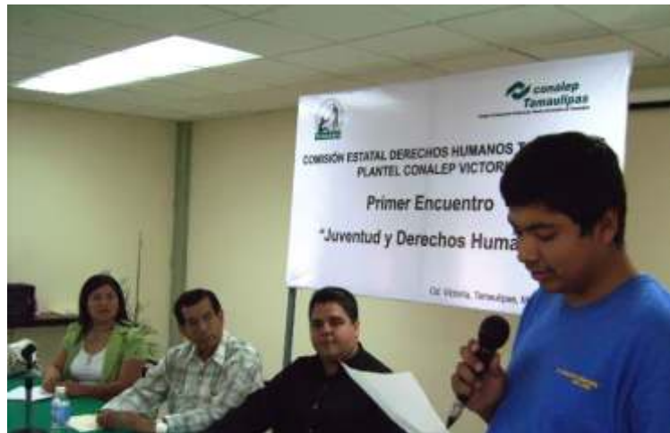
Los jóvenes tuvieron la oportunidad de expresar sus ideas.

Es menester señalar que, dado el interés de los jóvenes para participar con este Organismo, se continuará en estrecho contacto con este grupo para encauzar su dinamismo y energía en acciones positivas que redunden en un provecho para la sociedad tamaulipeca y para ellos mismos, por eso se está en el proceso de definir las actividades a seguir de las cuales pronto tendrán conocimiento.