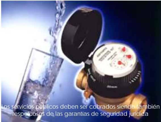
Los servicios públicos deben ser cobrados siendo también respetuosos de las garantías de seguridad jurídica

En las instalaciones de la Delegación Regional de esta Comisión en El Mante, hizo acto de presencia una ciudadana para interponer una queja la cual fue radicada con el número 17/2008; en esencia, la quejosa le atribuyó violaciones a sus derechos humanos al Gerente General de la Comisión Municipal de Agua Potable y alcantarillado de ese municipio, las cuales consistieron en que dicho Organismo le impuso un cobro excesivo por el suministro del agua, por la cantidad $3,191.55 pesos cuando anteriormente pagaba normalmente la cantidad de $200.00 pesos; en virtud, mediante propuesta conciliatoria, se le solicitó a la autoridad implicada realizara una inspección en el domicilio de la quejosa para verificar el medidor y determinar si existía algún tipo de desperfecto que pudiese