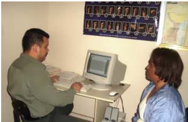
La CODHET está siempre atenta a las inquietudes de la ciudadanía.