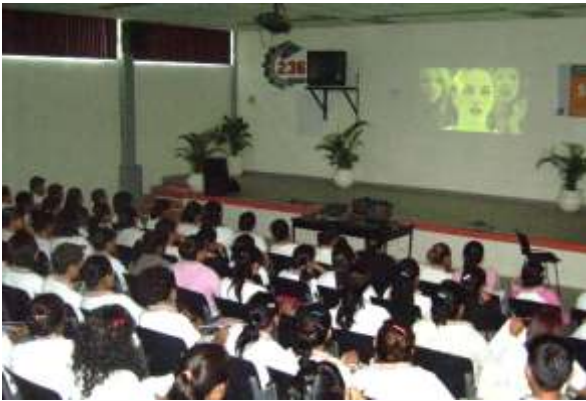
El contenido de los cortometrajes versó sobre la Declaración Universal de los Derechos Humanos.

Podemos citar entre los planteles educativos visitados al Colegio de Bachilleres del Estado de Tamaulipas (COBAT), Escuela Preparatoria Federalizada 1 y 2, Instituto de Computación e Informática (ICEI), CBTIS 236, CONALEP, ICES T Campus Victoria, es menester señalar el interés que despertó entre los jóvenes la impartición de esta actividad quienes expusieron sus diversos puntos de vista sobre los temas tratados que como ya se mencionó, fueron enfocados desde una perspectiva a los fenómenos y problemáticas que giran a su alrededor y que permitió captar con mayor facilidad su atención y dio pie a una mayor participación con motivo de esa identificación con sus realidades sociales.