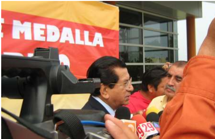
El Ombudsman Licenciado José Bruno del Río Cruz concediendo entrevistas a diversos medios informativos de la región.

Es de informarse que a fin de respetar el derecho a la información y realizar una mas amplia difusión del quehacer del Ombudsman en Tamaulipas, se han otorgado numerosas entrevistas a los diferentes medios de comunicación del Estado, con el propósito fundamental de dar a conocer todas las acciones y labores que llevan, a cabo en pro de los derechos humanos. Brevemente, podemos mencionar que entre los temas tratados a las fuentes de información social, destacan los relacionados con recepción e integración de quejas, medidas conciliatorias, gestorías y asesorías en diversas disciplinas del derecho, así como las visitas a las personas privadas de su libertad en las celdas de la policía preventiva y en los Centros de Ejecución de Sanciones.