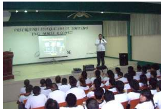
Concluidos los videos se hizo una reseña relativa a este instrumento internacional.