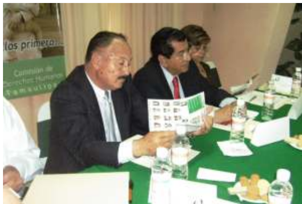
El Diputado Guadalupe González Galván asistió como invitado de honor a la sesión 2/08 del Consejo de la CODHET