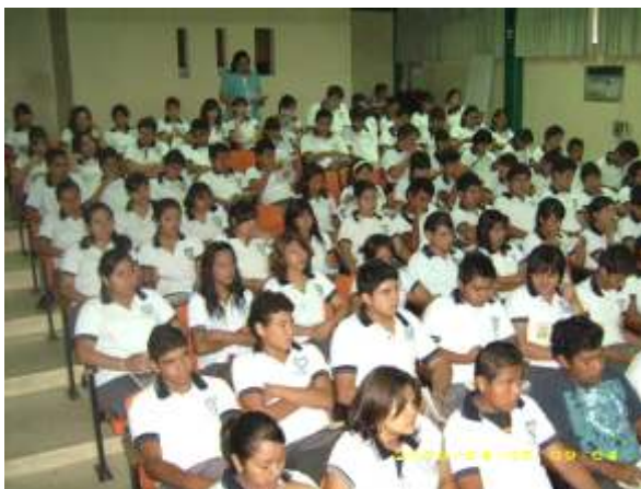
Jóvenes atentos a la proyección