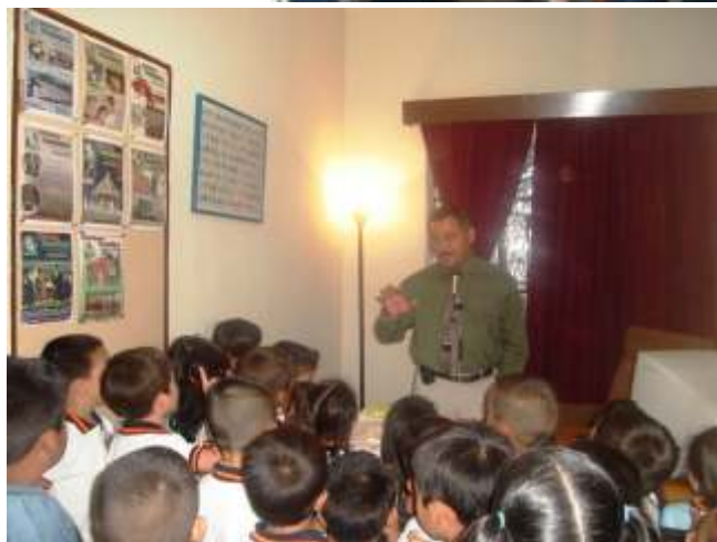
El Delegado Regional les explicó a los niños sobre las funciones de la CODHET.

Al final de esta actividad, los niños y niñas, así como sus maestras, agradecieron las atenciones y manifestaron su interés de conocer más sobre este Organismo, informándoles que las puertas están siempre abiertas.