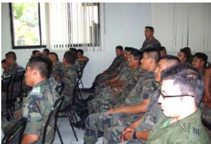
Los elementos de las fuerzas armadas plantean sus inquietudes

En ese contexto, este Organismo, pone especial atención en estas charlas, que precisamente tienen el objetivo de garantizar y proteger los derechos fundamentales de todo individuo en territorio tamaulipeco, específicamente, en lo que se refiere al respeto al principio de seguridad jurídica, por otra parte, se trasluce el interés de las fuerzas castrenses en que así sea.