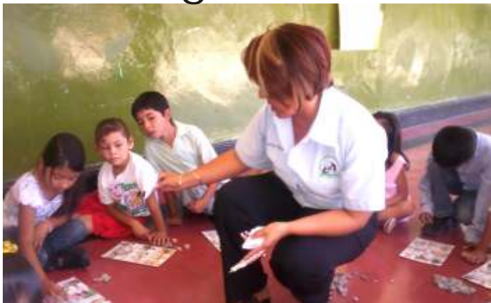
No se debe condicionar por ningún motivo el derecho a la educación.