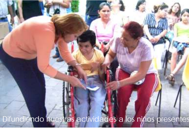
Difundiendo nuestras actividades a los niños presentes

La CODHET, en coordinación con la Secretaría de Desarrollo Social y el Instituto Tamaulipeco para la Cultura y las Artes a través de la Biblioteca Pública Central Estatal “Marte R. Gómez”, llevaron a cabo el día 29 de abril del un evento denominado Festival del Día del Niño, el cual tuvo lugar en el Jardín Central de la referida Biblioteca.