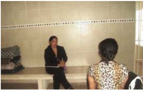
La privación de la libertad no es sinónimo de restricciones de derechos.

En la Delegación Matamoros se reforzaron las visitas a las celdas de la policía preventiva y al Centro de Ejecución de Sanciones, con el fin de brindar una debida atención a las personas en su detención provisional y las personas que se encuentran compurgando una pena privativa de libertad por la comisión de algún delito, realizando atenciones y gestiones a su favor relativas a sus garantías individuales. Este Organismo en diversas ocasiones ha precisado que con independencia de los motivos por los cuales una autoridad priva de su libertad a una persona, ésta, no pierde su