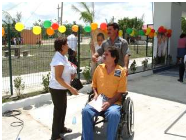
La difusión de los derechos fundamentales siempre es importante

Recordemos que la manera más ordinaria y común para difundir los derechos humanos es a través de pláticas, distribución de revistas, folletos y trípticos, capacitaciones, entrevistas a medios de comunicación, etcétera, que tienden a dar a conocer a todas las personas cuales son sus derechos y libertades fundamentales, especialmente, aquellas que integran lo que se denomina grupos vulnerables, que por su condición de género, salud, edad, situación jurídica, discapacidad, condición social, creencias religiosas, ideología política, preferencias, etcétera, son más susceptibles de que se vulneren sus derechos humanos, en ese sentido, esta Comisión está atenta para atender con diligencia cualquier solicitud de apoyo en detrimento a una garantía individual por parte de una autoridad.