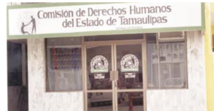
Panorama del exterior de las nuevas oficinas de la Séptima Visitaduría de la CODHET en Mante, Tamaulipas.