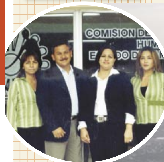
Cambio de titulares en oficinas CODHET

Órgano informativo de la Comisión de Derechos Humanos del Estado de Tamaulipas